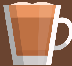
Cappuccino คาปูชิโน 卡布奇诺