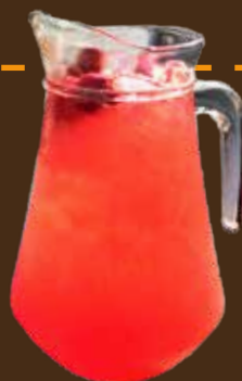
Strawberry Cooler 1 Liter สตรอว์เบอร์รี่ คูลเลอร์ 1 ลิตร 草莓酷乐鸡尾酒 (无酒精) ฿199