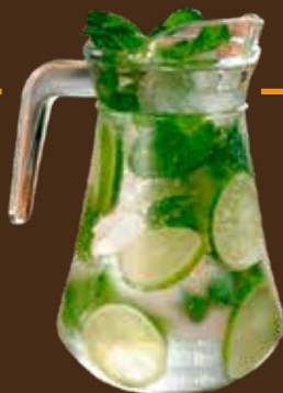
Virgin Mojito 1 Liter เวอร์จิน โมฮิตโต้ 1 ลิตร 无酒精莫吉托 1升 ฿289