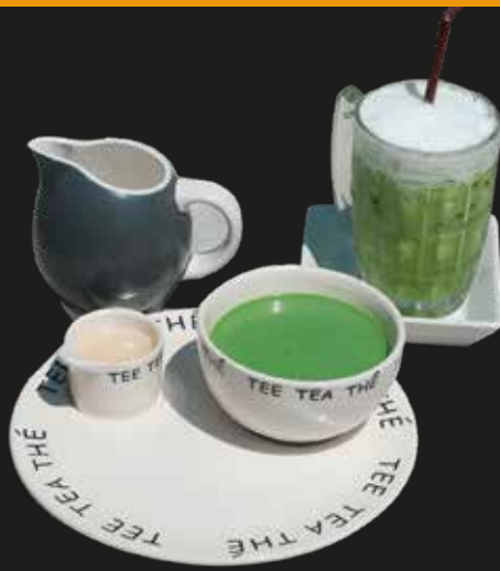
Green Thai Tea with Milk / ชาเขียวไทยใส่มilk / 奶茶 (泰国绿茶)