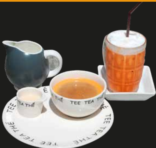
Thai Tea/ชาไทย / 泰式茶