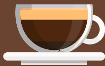
Espresso เอสเปรสโซ่ 意式浓缩咖啡