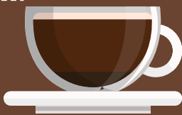
Black Coffee (Americano) กาแฟดำ (อเมริกาโน่) 黑咖啡 (美式)