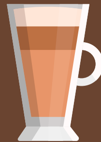
Latte ลาเต้ 拿铁