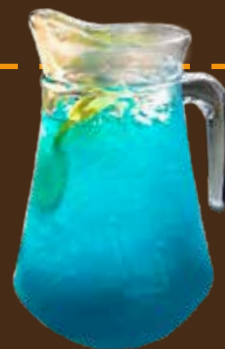
Nic's Paradise 1 Liter นิคส์ พาราไดซ์ 1 ลิตร Nic's天堂鸡尾酒 (无酒精) ฿199